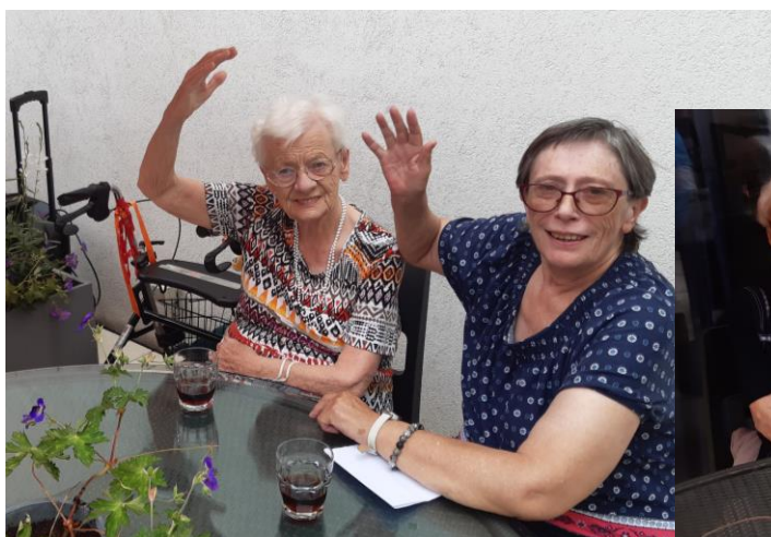
Aperitief op het terras