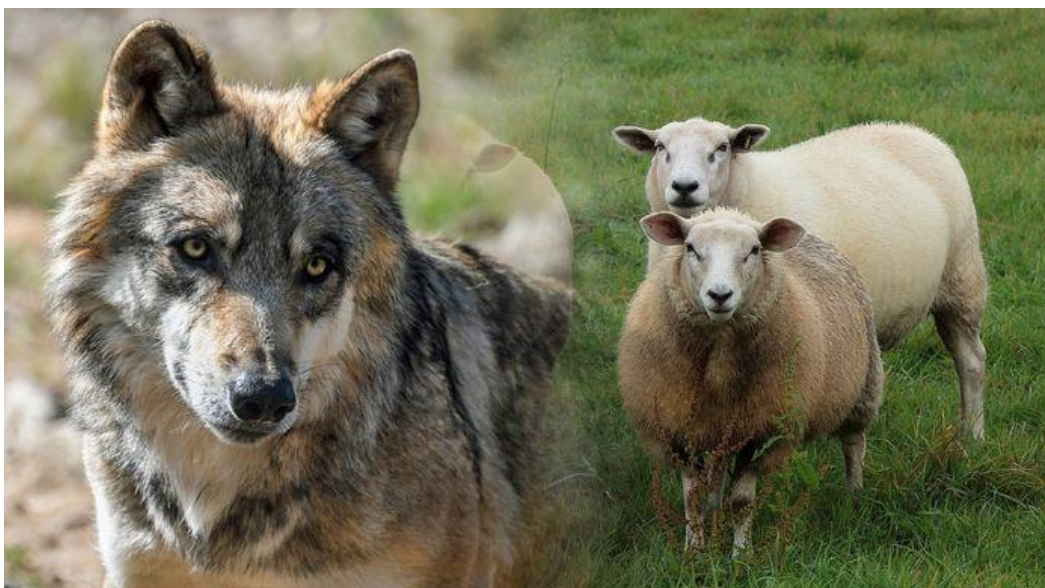
Wolf en schapen.

(bron: beleven.org.de volksverhalen almanak)